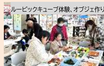
ルービックキューブ体験、オブジェ作り

「みんなで楽しく過ごせる場所を作りたい」の想いで、地域のシニア世代が中心となり、子ども食堂やお楽しみイベントを開催し交流しています。