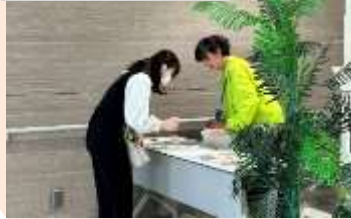
里親制度に関する相談会

一人でも多くの子どもが家庭という環境で暮らすことができるよう、出前講座やパネル展を通し、里親制度の普及・啓発活動を行っています。