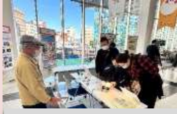
小型の太陽光発電パネルを使った実験など

防災力のある地域づくりを目指して、自然エネルギー（太陽光や雨水など）を利用した機器の作り方や、使い方の講習会を開催しています。