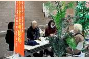
介護の悩み、介護方法相談会

「介護は十人十色」介護経験者が、心おきなく語り合える場の提供や会報の発行、電話相談等を通し、笑顔の介護につなげられるよう活動しています。