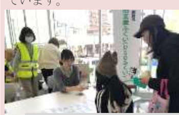
防災カルタ、防災リュックの展示など

災害時における女性視点での避難所レイアウトや備蓄・非常持ち出し袋リスト作成、市民向け防災カルタ作成や防災訓練時に非常持ち出し袋の説明等を行っています。