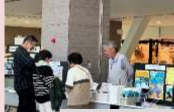
メンバーの発明品の展示

身近なテーマを題材にアイデアを持ち寄り、新しい便利グッズを生み出しています。中には、特許取得品を商品化し販売もしている発明品もあります。