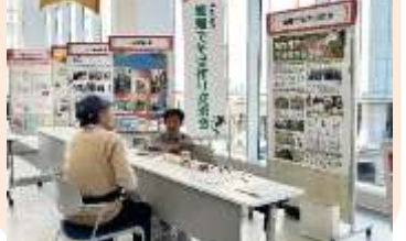
焼畑でそば作りの活動紹介

伝統的な焼畑農法の継承と味見河内の地域振興を図るため、「河内の焼畑そば」のブランド化を目指し、栽培から製粉まで行っています。