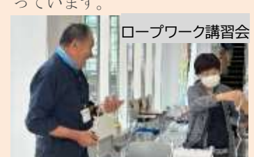
ロープワーク講習会

被災地でのボランティア活動のサポート、生活環境の回復、各種重機・工具類（クローラダンプ、ショベルカー、チェーンソーなど）の使用法の講習を行っています。