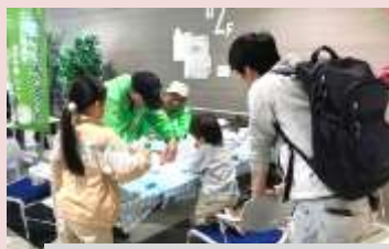
エコドライブ体験、万華鏡作りなど

出前講座やイベント会場での省エネ方法の講義や体験を通し、地球温暖化の現状や対策に関する知識の普及、地球温暖化防止活動（デコ活）に取り組んでいます。